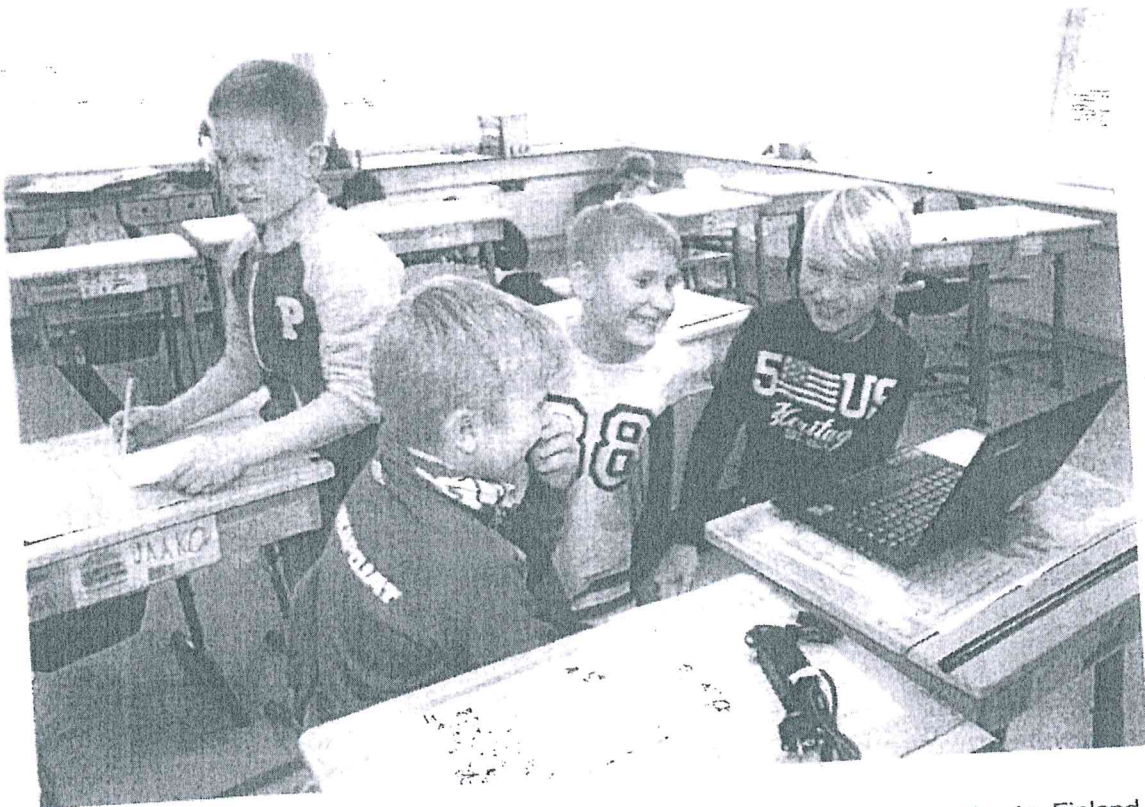
In the picture students are working on their StarT projects in Nöykkiönlaakson koulu, Finland

https://start.luma.fi/en | info@start.luma.fi | Subscribe to the StarT newsletter