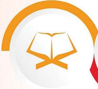
Kur'an-ı Kerim'i Güzel Okuma Yarışması