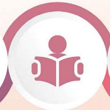
Okuyan 7' ler