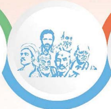
Kırk Şair 40 Şiir