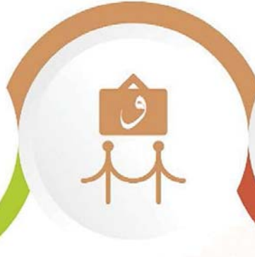
Görsel Sanatlar Sergisi