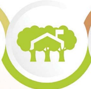
Yeşil Çevre Temiz Okul