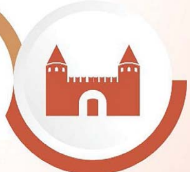
Müze İle Eğitim