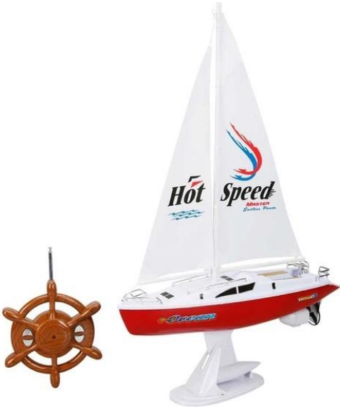
Suncon Uzaktan Kumandalı Yelkenli Tekne 38 Cm.