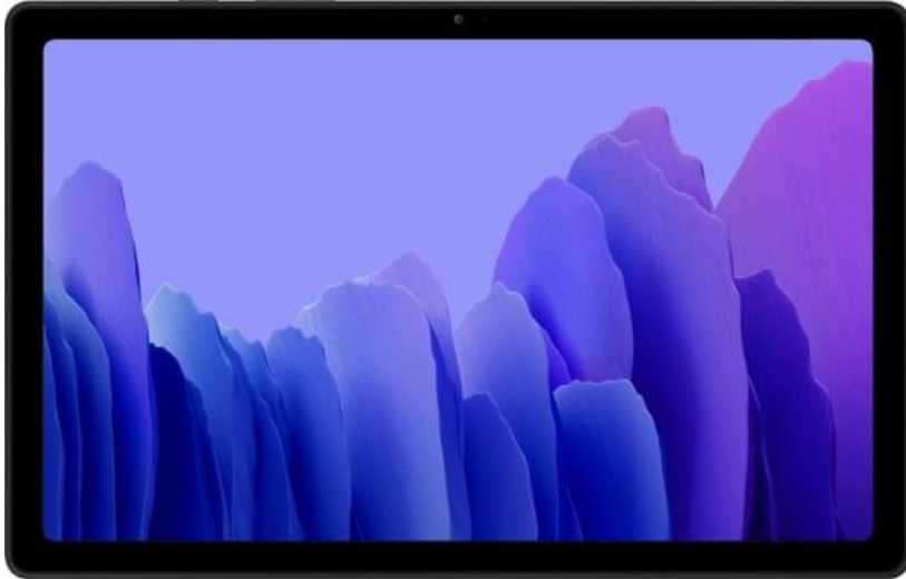
Samsung Galaxy Tab A7 SM-T500 32 GB 10.4" Tablet