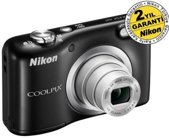
Nikon Coolpix A10 Black Dijital Kompakt Fotoğraf Makinesi