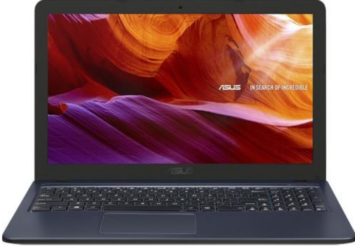
Asus F543NA-GQ339T Intel Celeron 4GB 128GB SSD Windows 10 Home 15.6" FHD Tařınabilir Bilgisayar