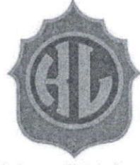
Kabataş Erkek Lisesi