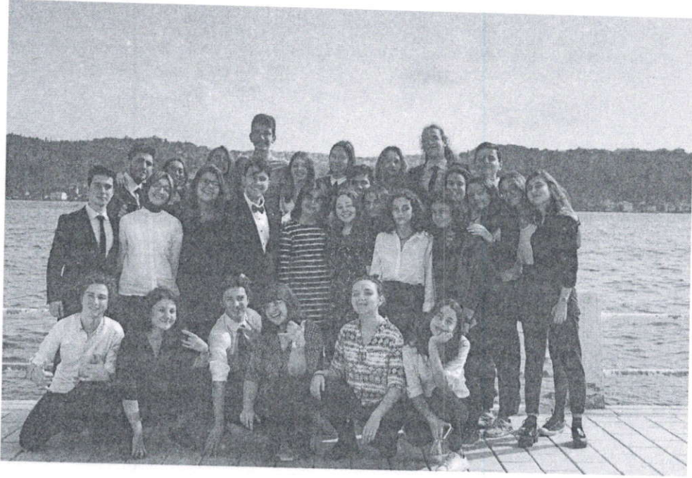
2019 yılı yönetim takımımız