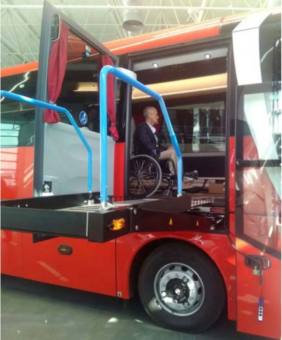
Fotoğraf 30. Türkiye MAN Firması tarafından Ankara'da üretilen ama henüz Türkiye'de hiç olmayan şehirler arası asansörlü otobüs.

Manuel bir tekerlekli sandalye kullanıcısı baston kullanan kişiye göre otogar içerisinde hareket etmek için daha avantajlı sayılabilir. Manuel tekerlekli sandalye bagaja rahatlıkla konulabilmektedir. Akülü tekerlekli sandalye kullanıcıları için durum o kadar kolay değil. Otobüslerin bagaj yüksekliğinin fazla olması bir avantaj oluştururken, akülü tekerlekli sandalyenin ağır olması ve bu otobüslerde rampa bulunmaması akülü tekerlekli sandalyelerin bagaja konmasını güçleştirdiği gibi bagaja taşınırken sandalyenin zarar görmesine de neden olabilmektedir.