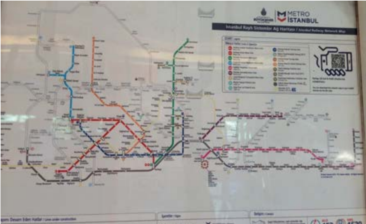
Fotoğraf 11. İstanbul Metro: İstasyonlarda, peronda, herkesin görebileceği yere asılmış ve yeterli büyüklükte metro ağı haritası. Belli noktalarda kabartma haritalar da yer almaktadır.