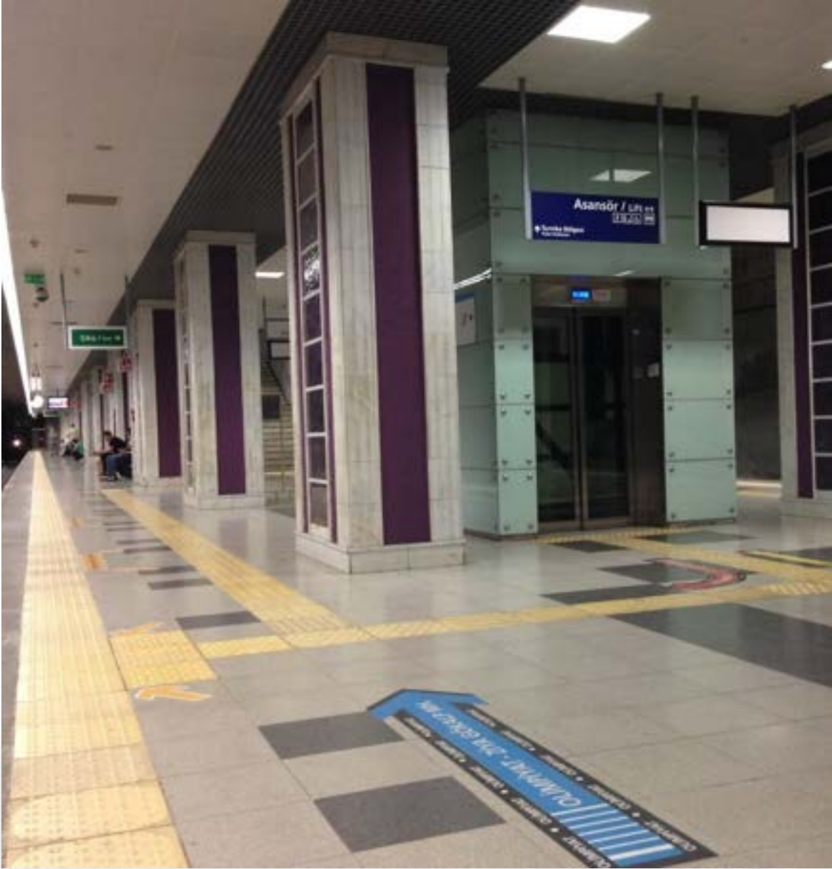
Fotoğraf 9. İstanbul Metrosu binış peronuna asansör ile erişim, yönlendirme ve bilgilendirme işaretleri, hissedilebilir yürüme yüzeyi işaretleri.

Havanın durumu ve yapılı çevrenin durumu ile topografya hareketi doğrudan etkilemektedir. Şöyle ki, havanın yağışlı olup olmaması, zemin kaplamalarının kaydırmaz olup olmadığı, zemin kaplamalarının yüzeyin düz ve pürüzsüz olması, yokuş tırmanışları var ise mesafenin uzunluğu, taşınması gereken bir yük var ise bu durumun güclüğü baston kullanan birey ile tekerlekli sandalye kullanan birey arasında ciddi farklılıklar oluşturmaktadır. Baston, yürüteç veya başka bir yardımcı araç ve gereçle yürüyen engelli bir birey için mesafe 50 metreden daha fazla olması hareketliliği güçleştirmektedir. Manuel tekerlekli sandalye ile eğim olmayan ve yağışlı olmayan durumlarda daha kolay hareket edilebilmektedir. Akülü tekerlekli sandalye ile bu zor durumlar çok daha kolay aşılabilmektedir.