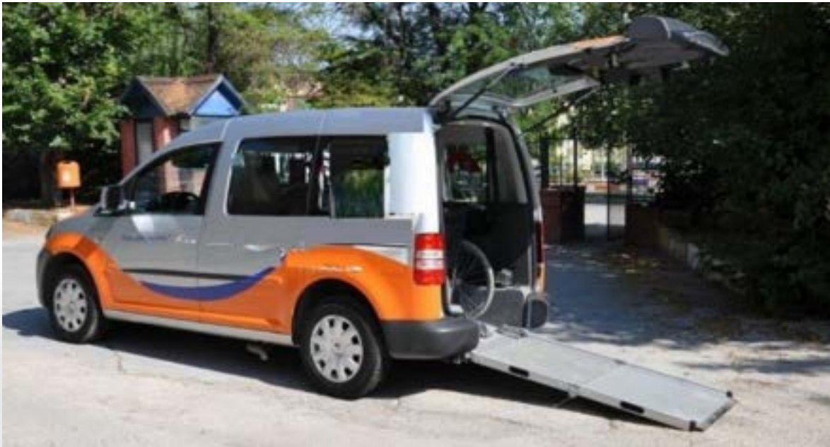
Fotoğraf 2. Tekerlekli sandalye ile binilebilen yüksek tavanlı özel otomobil.

Seyahat için özel otomobilin tercih edilmesi sadece ekonomik değil diğer faktörlerin etkileriyle de ortaya çıkmaktadır. Seyahat edilecek yer ve mesafesi önemli olmakla birlikte ulaşımında trafik yoğunluğu ve seyahat sonunda araç park yeri bulunup bulunmaması da çok önemlidir. Bu yüzden, birçok ortopedik engelli özel otomobilinin bagajında manuel tekerlekli sandalyesini taşımaktadır. Mekânsal büyüklüğü nedeniyle uzun mesafeli yürüme ve hareketlilik gerektiren büyük alışveriş merkezlerinde baston, koltuk değneği ya da yürüteçlerle hareket etme yorucu olduğundan manuel tekerlekli sandalye kullanmak engelliler tarafından daha çok tercih edilmektedir.