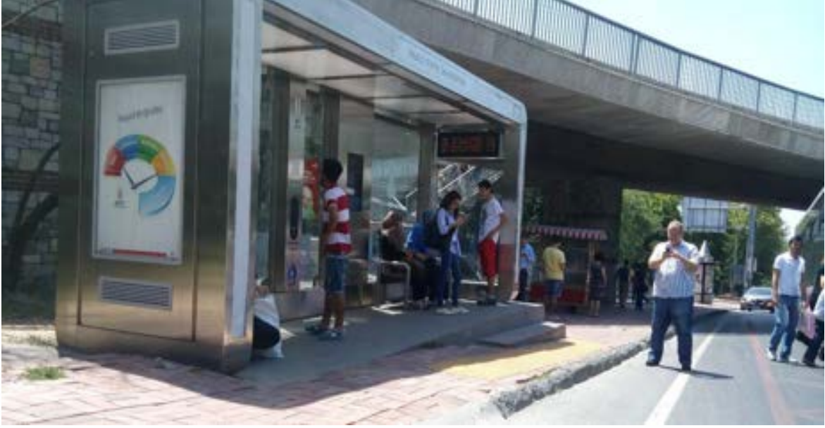
Fotoğraf 13. İstanbul Yıldız Teknik Üniversitesi durağı, akıllı durak modeli: Erişilebilir değil ve otobüs yolcu indirip bindirme için durağa tam olarak yanaşmıyor.