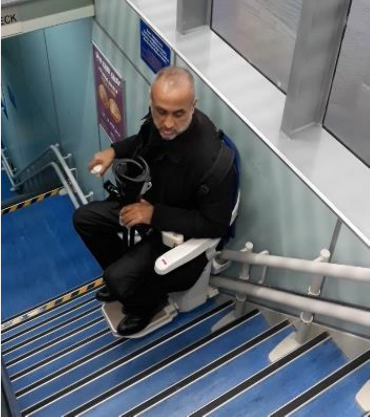
Fotoğraf 35. İDO İstanbul Yalova seferi, gemi içerisinde hareket kabiliyeti kısıtlı bireylerin merdiveni çıkabilmeleri için oluşturulan koltuklu asansör sistemi.

Havaalanlarında veya hızlı tren istasyonlarında olduğu gibi hareket kabiliyeti kısıtlı bireylere destek olacak hizmet biriminin olmaması gemi ile seyahat tercihini azaltabilmektedir. Arabalı vapurlarda alt katların otomobiller için ayrılmış olması ve yolcular için ayrılmış olan üst kata çıkış için asansör olmaması seyahat konforunu olumsuz yönde etkilemektedir. Yolcu gemilerinin alt katında engelli bireylerin koltuklarında seyahatlerini tamamlayabilecek olmaları olumlu gibi görünmekle birlikte, tuvaletlerin çoğunlukla engellilere uygun olmaması, kafeterya hizmetlerinin üst katta olması, açık havada deniz manzarası seyrinin üst katta olması ve üst kata erişimin çoğunlukla sadece merdiven ile olması gemi ile seyahat tercihini azaltmaktadır.