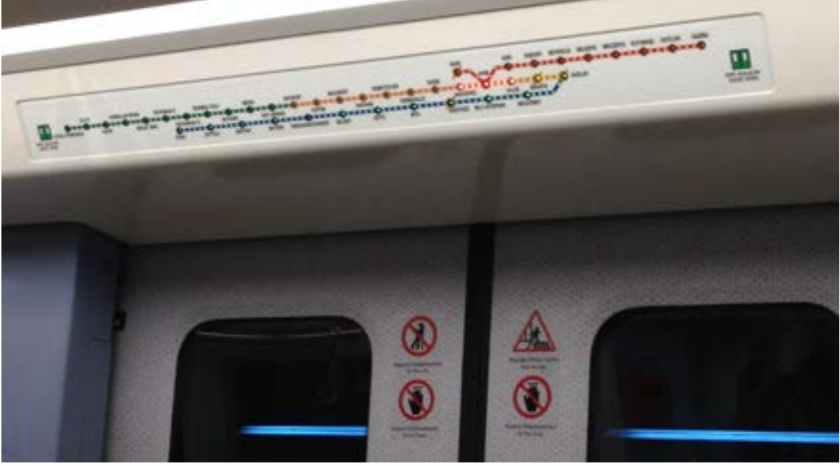
Fotoğraf 7. Ankara Metrosu: Vagon içi istasyonları takip edebileceğiniz ışıklı sistem.

Raylı sistem istasyonlarında mesafeler uzun olduğu için bastonlar ile yürümek güç olabilmektedir. Tekerlekli sandalye ile hareket etmek ise daha kolay olmaktadır.