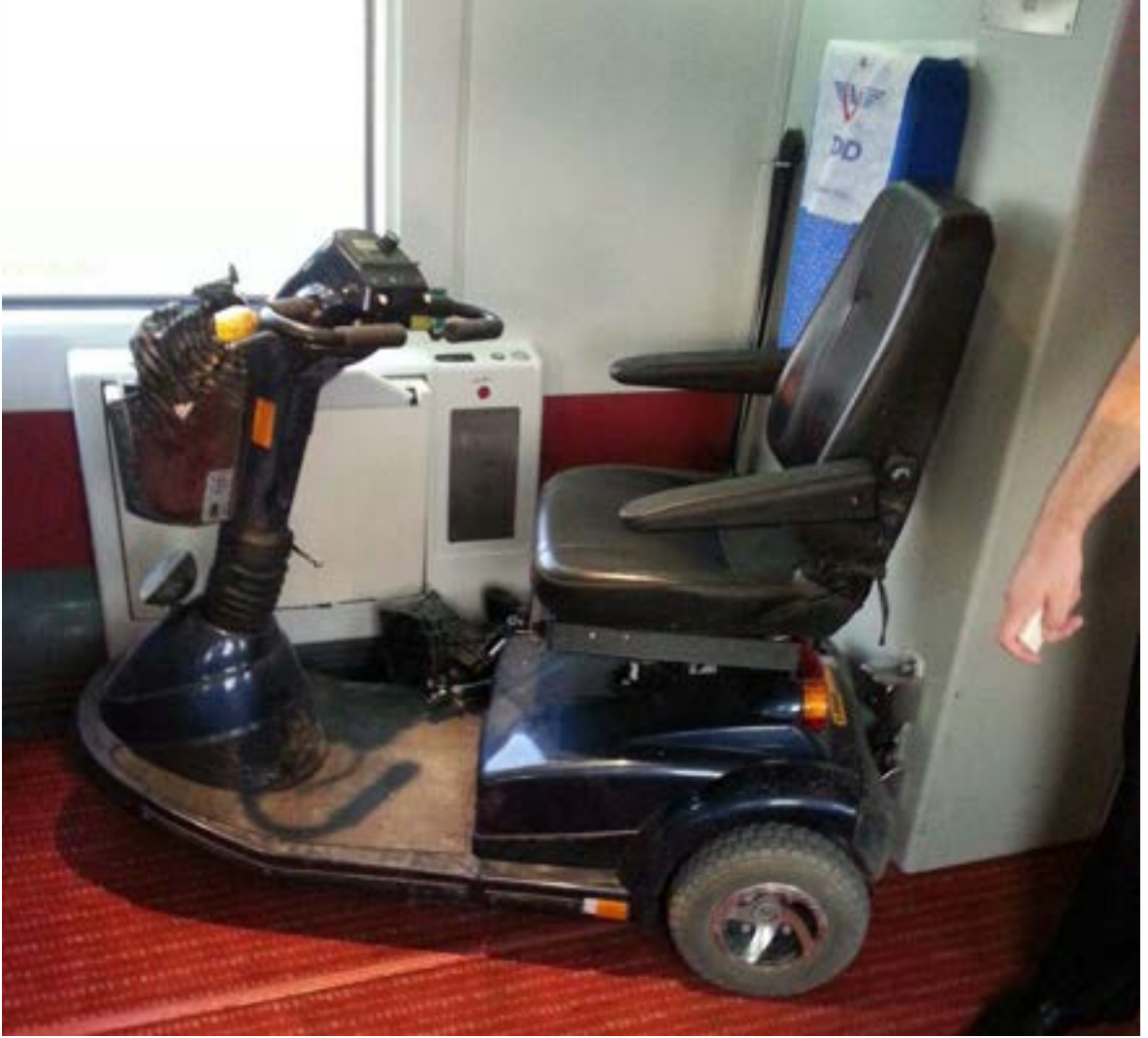
Fotoğraf 23. TCDD Yüksek Hızlı Tren Ankara Eskişehir Seferi, 2 numaralı vagon için tekerlekli sandalye ile seyahat için ayrılan alan.