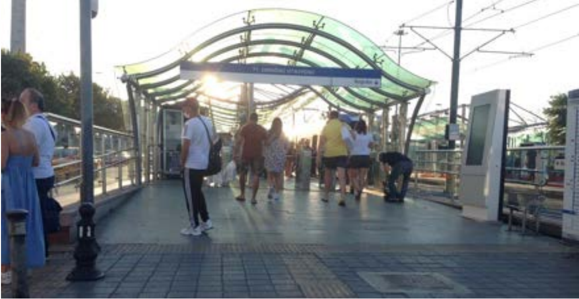
Fotoğraf 4. İstanbul Eminönü hafif raylı sistem peronu. Rampa eğimi ve genişliği, zemin kaplaması uygun, hissedilebilir yürüme yüzeyi işareti uygulanmış, yönlendirme bilgilendirme işaretleri yeterli ve doğru konumlandırılmış.

Metro ve hafif raylı sistemler, ortopedik engelli bireyler tarafından en çok tercih edilen toplu taşıma araçlarından birisidir. Raylı sistemlerde ilk hareket edilen yerden binilen durağın olduğu mesafe ile inmenin planlandığı yerdeki duraktan gidilecek yere olan mesafe önemlidir.