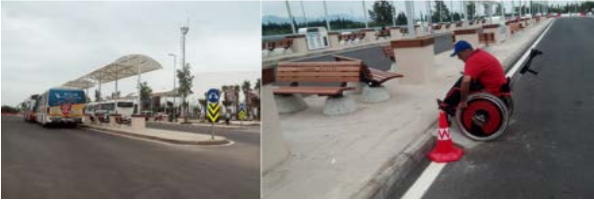
Fotoğraf 14. Antalya Expo otobüs durağı: Durağa standartlara uygun erişilebilir rampa oluşturulmamış, mobilyalar yeterli manevra alanları olmayacak şekilde yerleştirilmiş.

Seyahat halinde iken tekerlekli sandalye akülerinin şarjlarının azalması veya tükenmesi engelli bireyi yolda bırakabilmektedir. Bu durumda, akülü tekerlekli sandalyeyi ancak birkaç kişinin taşıyabileceği şekilde bir kamyonete veya tekerlekli sandalyeler için özel olarak tasarlanmış araçlar ile taşımamız mümkün olmaktadır. Türkiye’de akülü tekerlekli sandalye için yeterince alan yer almadığı için taksiye veya özel binek aracına tekerlekli sandalye ile binilememektedir. Akülü tekerlekli sandalyeler çok büyük ve ağırdır. Akülü tekerlekli sandalyenin çok ağır olması ve kolay ittirilebilir olmaması nedeniyle birisinin ittirerek bir yere götürmesi de çok mümkün değildir. O nedenle özel asansörlü veya rampalı araç gelene kadar akülerin bittiği yerde zorunlu olarak bekleme durumu ortaya çıkmaktadır. Şarj aletiniz yanınızda ise, en yakın yerde bir priz bulup elektrik enerjisi ile veya yerel yönetimin belirli noktalara koyduğu akü şarj üniteleri ile akülerinizi şarj edebilirsiniz. Gideceğiniz mesafeye göre bir saat şarj sonrası kısa süreliğine de olsa yeniden hareket edebilir duruma gelebilmek mümkündür. Akülü tekerlekli sandalyelerin tamamen şarj olması 4-8 saat arası değişebilmektedir.