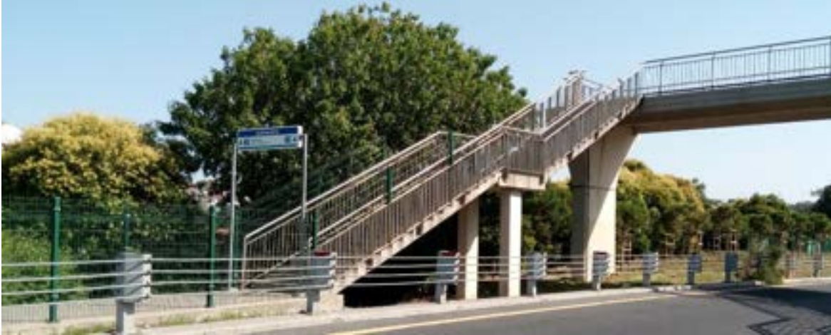
Fotoğraf 16. İstanbul Burhaniye Metrobüs Durağı üst geçit bağlantısı, rampa veya asansör uygulaması yok.

Toplu taşıma araçlarını kullanarak seyahat edildiğinde, gelecek olan otobüsün asansörünün çalışıp çalışmadığı bilinmediği için bu durum devamlı bir kaygı oluşturmaktadır. Ayrıca minibüslerin erişilebilir olmaması nedeniyle akülü tekerlekli sandalye ile seyahat daha da güçleşmektedir. Seyahat edilecek güzergahta ulaşım yalnızca erişilebilirliği olmayan minibüslerle sağlanıyorsa sorun daha da ciddi bir hal almaktadır.