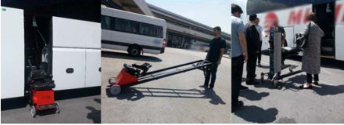
Fotoğraf 31. Henüz deneme aşamasında olan, şehirler arası otobüsler için üretilen prototip otobüs merdiven aparatı, Ankara AŞTİ.

Otobüslerde merdivenleri tırmanan bir aparat olmaması veya otobüslerde asansör sistemi olmaması nedeniyle otobüsün içerisine geçmek kolay olmamaktadır. Kollarınızı kullanabiliyorsanız merdivenlere oturarak basamakları çıkabilir veya bir kişinin yardımıyla, genellikle kucaklanarak koltuğunuza götürülebilirsiniz. Yolcunun ve taşıyanın cinsiyetlerinin farklılığı, yolcunun engellilik özellikleri, kilosu gibi faktörler otobüsün içerisine binışı çok güç hale getirmektedir. Bu durum hiç kimsenin istemeyeceği bir durum elbette.