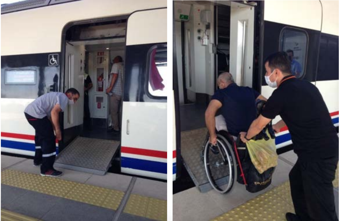
Fotoğraf 22-23. Hızlı Tren İstanbul Söğütluçeşme istasyonunda peron-tren erişilebilirliği ve Turuncu Hizmet Noktası görevlisinin tekerlekli sandalyeli yolcuya yardımı.