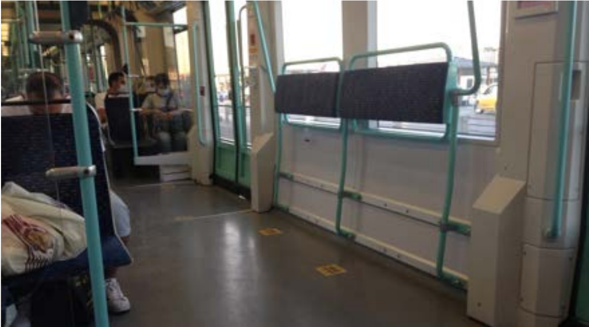
Fotoğraf 5. İstanbul hafif raylı sistemde tekerlekli sandalye kullanıcıları ve bebek arabalı bireyler için ayrılmış alan, aynı zamanda ayakta duran bireylerin seyahat sırasında yaslanması için de uygun düzenleme yapılmış.