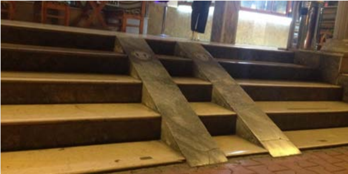
Fotoğraf 32. Ankara-İzmir arası şehirlerarası karayolu seyahati mola yeri.

Ayrıca zaten devamlı tekerlekli sandalye kullanan bireylerin uzun süre oturma pozisyonu ve seyahat süresinin uzunluğu, mola yerlerinin erişilebilir olmaması, tuvalet ihtiyacının sadece mola yerinde giderilebiliyor olması, seyahat süresinin çok net olmaması, ilave duraklara uğranılabiliyor olması, yol güvenliğinin diğer taşıtlara göre az olması, mola yerlerinde otobüse inip binmenin getirdiği güçlükler, otobüs firmalarının belirtmedikçe indirim uygulamaması ya da kanunda yazdığı gibi uygulamıyor olması, konforlu olmaması gibi nedenler zorunlu olmadıkça otobüs seyahati tercihini öncelikli olmaktan uzaklaştırmaktadır.