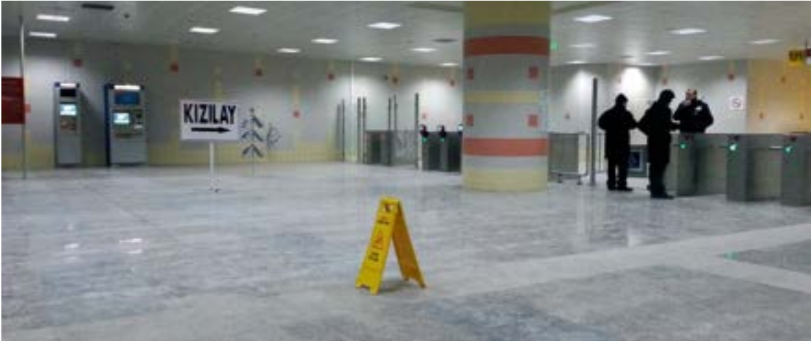
Fotoğraf 1. Ankara M2 Metro istasyonu, Kaygan Zemin Kaplamasını tescilleyen tabela.

Yazar, 53 yaşındadır. Bir yaşında geçirdiği çocuk felci sonrası oluşan sekel, sol alt ekstremitede kas gücü sıfır, sağ alt ekstremitede 2 civarındadır. 2011 yılından itibaren Ankara'da yaşamaktadır. Seminer, toplantı, gezi, spor organizasyonu gibi etkinlikler nedeniyle Türkiye'nin birçok bölgesine ve kentine seyahat etmiştir. Uzun yıllar tekerlekli sandalyede basketbol oynamış ve tekerlekli sandalye ile atletizm yapmıştır. Kısıklık gidermeli olan uzun bacak yürüme ortezi ve kanedyen baston kullanarak çok uzun olmayan mesafeleri yürüyebilmektedir. Uzun mesafe yürümesi gerektiğinde manuel aktif bir tekerlekli sandalye kullanmaktadır. Yokuş çıkması gerektiğinde veya bir yük taşınması durumunda akülü tekerlekli sandalye ve koşmak için boyu 1,5 metreden uzun olan atletizm tekerlekli sandalyesi kullanmaktadır. Basketbolu, bu spor dalına özel, sokakta kullanılma imkânı olmayan, ana tekerlekleri açılı bir tekerlekli sandalye ile oynamaktadır.