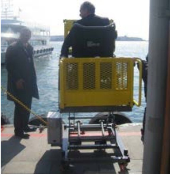
Fotoğraf 18. İstanbul Kabataş iskelesinde şehir için gemi seyahati için yapılan gemiye biniş asansörü.

İstanbul ve İzmir gibi şehir içi seyahatin gemi ile sağlandığı kentlerde kullanılan araçlar tekerlekli sandalye kullanıcıları için çok da tercih edilmemektedir. İskeleden gemiye geçerken kullanılan platformun dik olması, bazı yerlerde tırtıklı tahtaları kullanmaları gemiye binışı ve inişi güçleştirmektedir. Gemi içerisinde de tuvalet kullanımının güçlüğü göze çarpmaktadır. Gemi seyahatinin güzel tarafı; denizi, boğazı ve manzarayı seyretmektir. Fakat tekerlekli sandalye kullanıyorsanız, genellikle erişilebilir ve güvenli olmadığı için bu manzarayı doyasıya seyredeceğiniz geminin dış yanına çıkmak pek mümkün değildir. Bazı mekânlar arası eşiklerin 20 cm yüksekliğine ulaşması insanları olduğu kadar tekerlekli sandalye kullanıcıları için de engelleyici faktör olarak karşımıza çıkmaktadır.