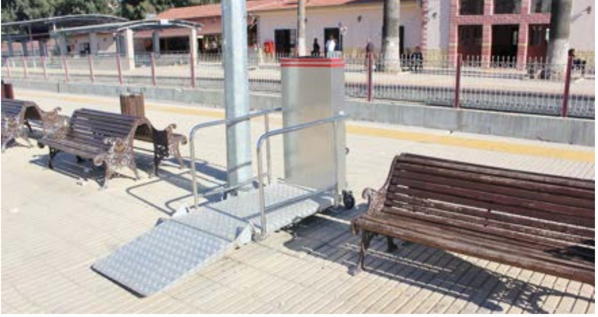
Fotoğraf 25. TCDD Tarsus İstasyonu, tekerlekli sandalyenin vagona binmesine yardımcı manuel asansör sistemi.