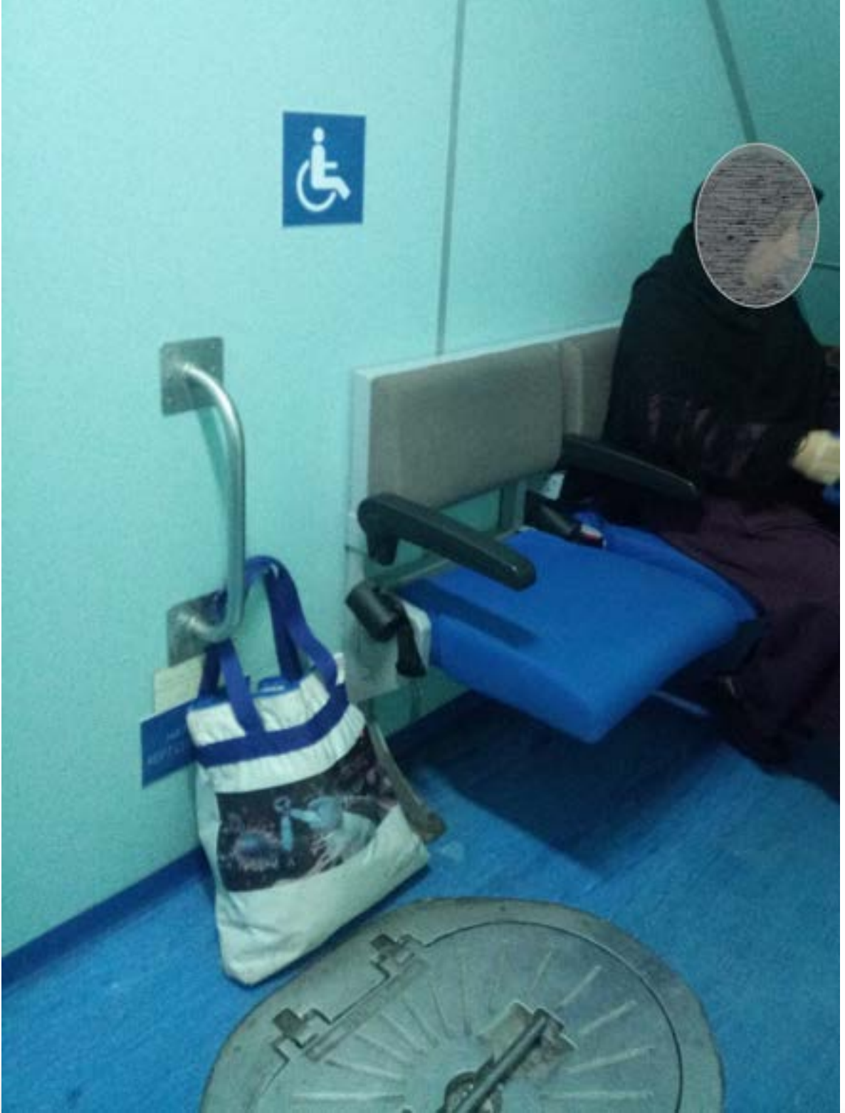
Fotoğraf 34. İDO İstanbul Yalova seferi, gemi içerisinde merdiven altında valiz koyma yerinin yanında oluşturulan tekerlekli sandalye seyahat alanı.