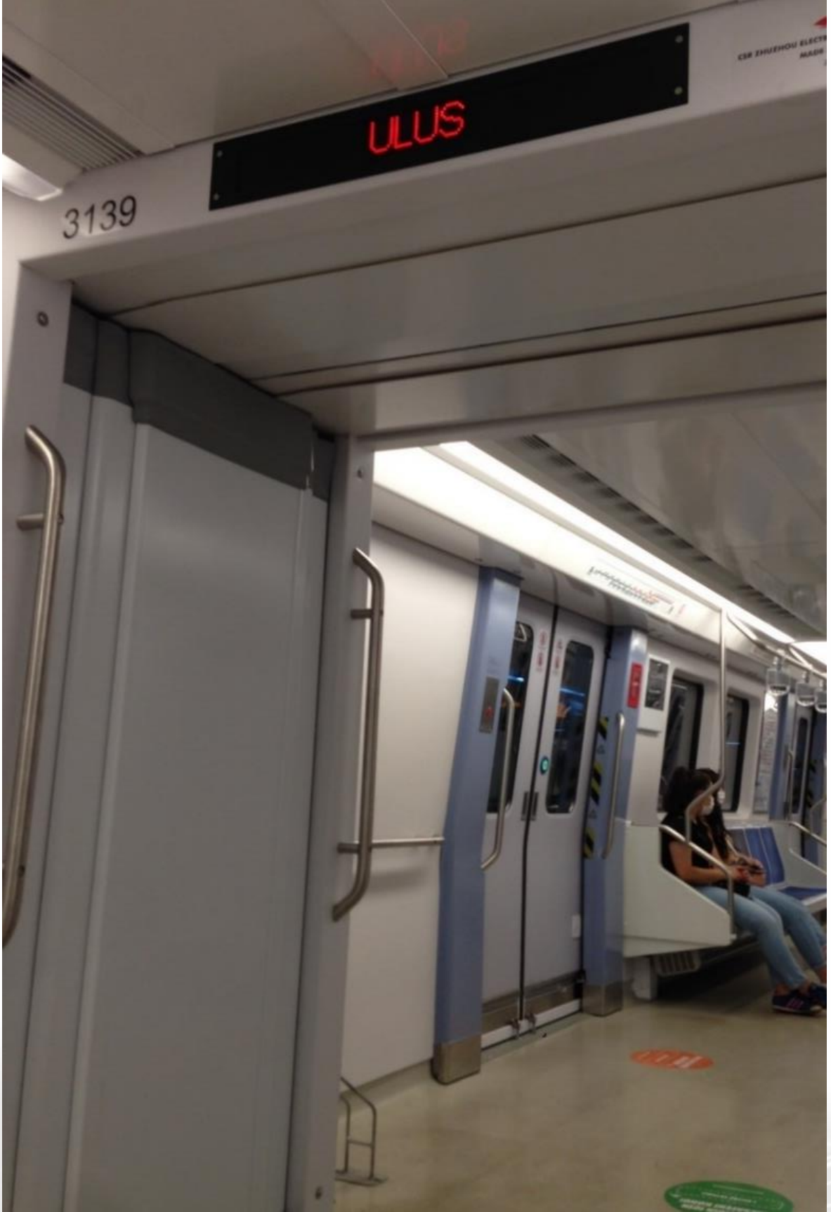
Fotoğraf 6. Ankara Metro'su: Tekerlekli sandalye, bebek arabası ve bisiklet için ayrılmış alan, bir sonraki istasyonu gösteren ışıklı pano.