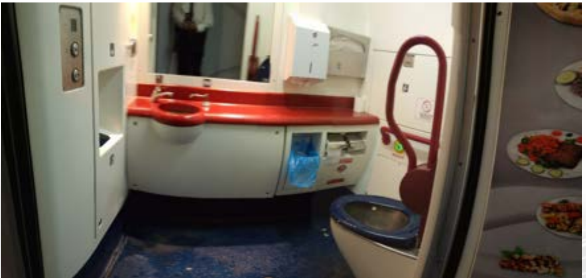
Fotoğraf 24. TCDD Yüksek Hızlı Tren, Ankara Eskişehir seferi, 2 numaralı vagon, herkes için erişilebilir tuvalet.