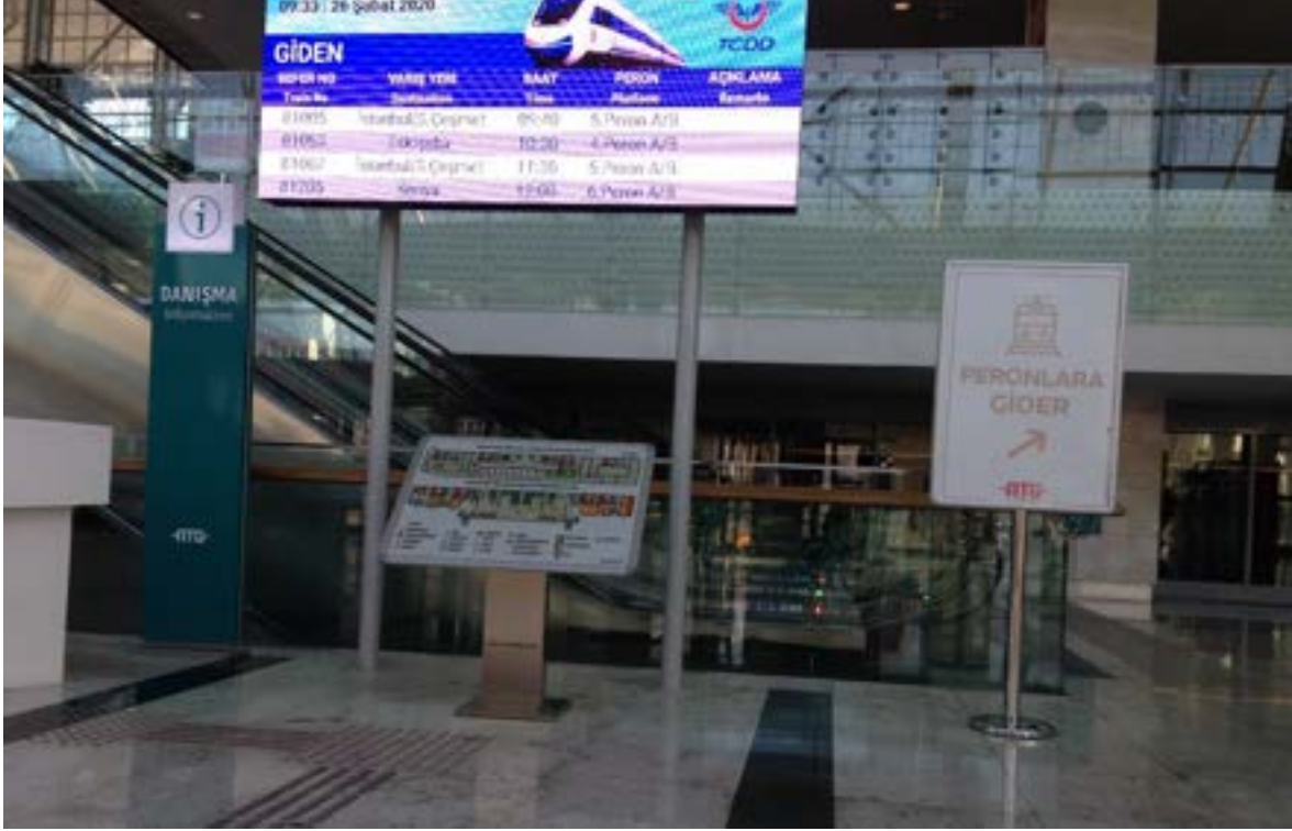
Fotoğraf 21. TCDD Ankara Gar kabartma harita ve giden gelen yolcu bilgilendirme panosu.