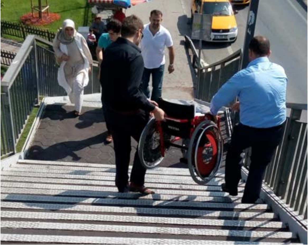
Fotoğraf 15. İstanbul Metrobüs durağına erişim için erişilebilir olmayan üst geçit bağlantısında ortopedik engelli bireyin tekerlekli sandalyesi vatandaşlar tarafından taşınıyor.