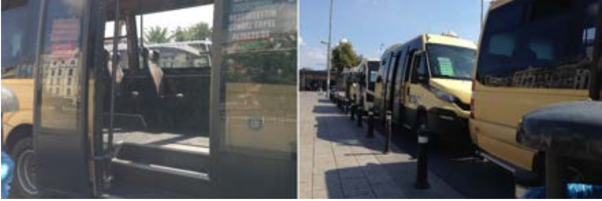
Fotoğraf 17. İstanbul Fatih İlçesi Aksaray semti minibüs dolmuş durağı: Minibüsler erişilebilir değil.