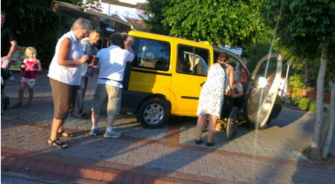
Fotoğraf 3. Antalya ili Alanya ilçesinde yüksek tavanlı taksi örneği.

Her ne kadar baston, protez, ortez veya diğer yardımcı araç gereçlerle hareket edebilen ve otomobil kullanamayan ortopedik engelli bireyler için taksi önemli bir seçenek olmakla birlikte, tekerlekli sandalye ile binilebilen yüksek tavanlı ve standart fiyatlı taksilerin sınırlı sayıda hizmet sunuyor olması bu tercihi sınırlandırmaktadır.