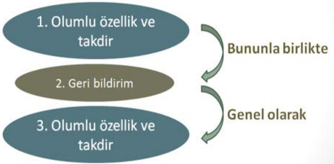
Şekil 2. Sandwich Tekniği. (Kaynak: Anka Koçluk A.Ş. (n.d.). Module 1 Book Science and Art of Coaching)

Sandwich tekniğindeki en önemli noktalardan biri “ama” ve “fakat” gibi bağlaçların cümleleri bağlarken kullanılmamasıdır. Çünkü bu kelimeler kendinden önce gelen cümlenin anlamını zayıflatır.