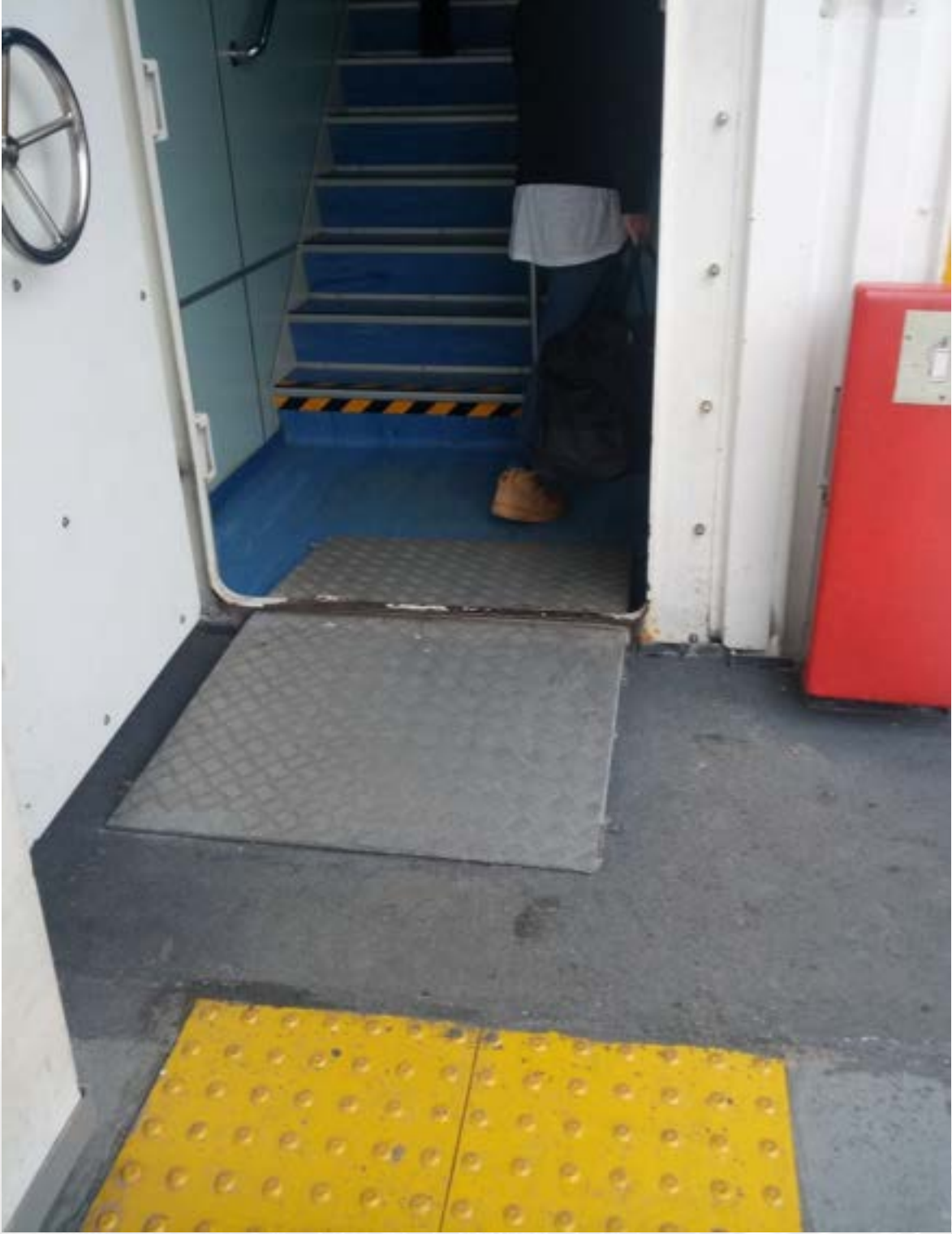
Fotoğraf 33. İDO İstanbul Yalova seferi, kapı eşiğine rampa yapılmış fakat yaklaşık 3 cm yükselti kalmış. Rampanın merdiven tarafında yeterli sahanlık yok.

Üç tarafı denizlerle çevrili ülkemizde şehirler arası deniz yolu seyahat maalesef yeterince gelişmiş ve yaygınlaşmış durumda değil. Engelli bireyler açısından konuyu ele aldığımızda ortopedik engellinin karşısına ilk olarak gemiye biniş ve iniş güçlüğü çıkmaktadır.