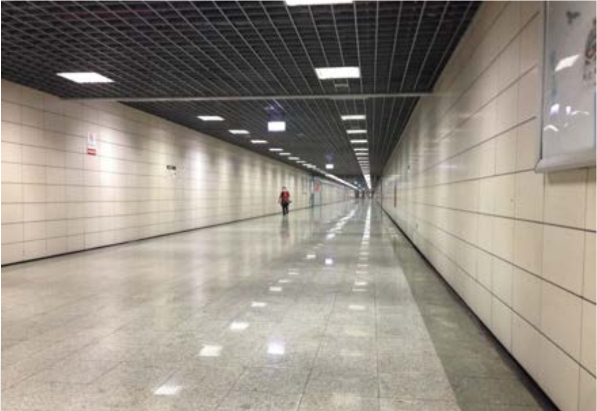
Fotoğraf 8. İstanbul Metrosu: Metro hatları arası bağlantı yolunun çok uzun olması, bu mesafeyi kat edebileceğiniz golf aracı gibi yöntemlerin olmaması, zemin kaplamasının kaygan olması ve ışık yansıtması, en az 30 metre aralıklarla dinlenme banklarının olmaması hareket kabiliyeti kısıtlı bireylerin ulaşım aracına varmasını güçleştirmektedir.

Raylı sistem istasyonlarında mesafeler uzun olduğu için bastonlar ile yürümek güç olabilmektedir. Tekerlekli sandalye ile hareket etmek ise daha kolay olmaktadır.