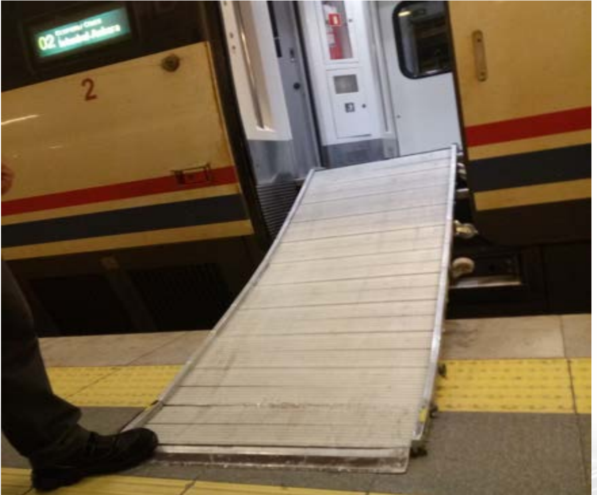
Fotoğraf 26 TCDD Ankara Gar, Yüksek Hızlı Tren 2 numaralı vagon girişi, tekerlekli sandalye için rampa.