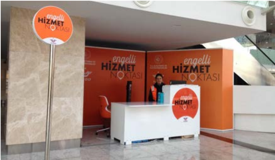
Fotoğraf 20. TCDD Ankara Gar Turuncu Masa Engelli Hizmet Noktası.

Ankara ve İstanbul arası seyahatte ortopedik engelli bir birey olarak yazar çoğunlukla hızlı treni tercih etmektedir. Hem hızlı ve güvenli bir ulaşım aracı olması, ücretsiz seyahat edilebiliyor olması, biletin cep telefonu uygulaması ile bir dakika bile sürmeyen bir sürede alınabiliyor olması, kalkış ve varış saatlerinin çok net olması, seyahatin konforlu olması, vagon içerisinde tuvalet ve lokanta olması, tekerlekli sandalye için özel bir alanın olması, turuncu masa hizmet noktası personelinin gardan içeri girer girmez bilet kontrolden tren içi seyahat koltuğuna kadarki süreçte yardımcı olması, hızlı tren garının şehir merkezinde olması ve gara ulaşımın kolay olması, İstanbul'da Marmaray ile entegre olması seyahat planımı yüzde yüz etkilemektedir.