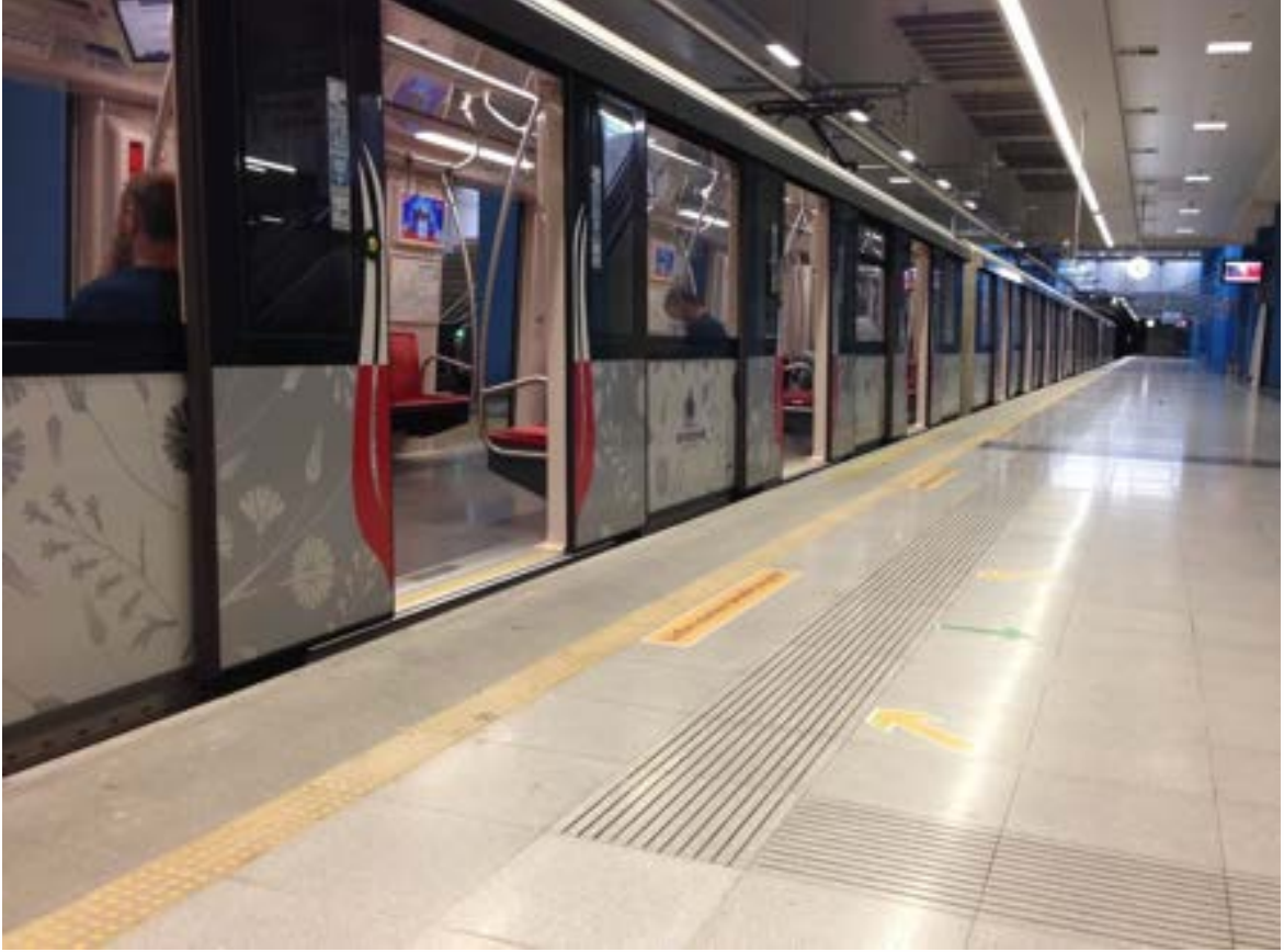
Fotoğraf 10. İstanbul Metro: Biniş peronu ile vagon arasındaki boşluk çok az ve eşit yükseklikte olması inişi ve binışı kolaylaştırmaktadır.