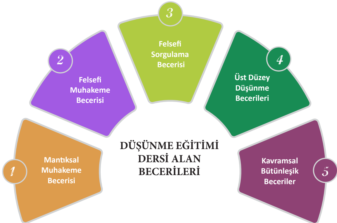
Şema 1: Düşünme Eğitimi Dersi Alan Becerileri

Aşağıda düşünme eğitimi dersi için belirlenen becerilerin ayrıntılı açıklamaları verilmiştir. Bu becerilerin içerdiği bütünlük beceriler ve onların ilgili süreç bileşenleri tablo ile gösterilmiştir. Tabloda yer alan "Bütünlük Beceriler" başlığı, kavramsal ve alan becerilerine ait bütünlük becerileri ifade eder. "Süreç bileşenleri" ise ilgili bütünlük becerilere ait alt bileşenleri gösterir.