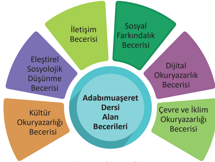
Şema 1: Alan Becerileri

Adabımuaşeret Dersi Öğretim Programı'yla öğrencilere kazandırılmak istenen alan becerileri şunlardır: